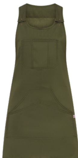
102 Verde militare