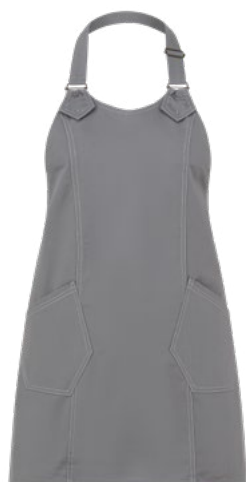
C02 Grigio chiaro