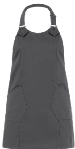
M12 Grigio medio