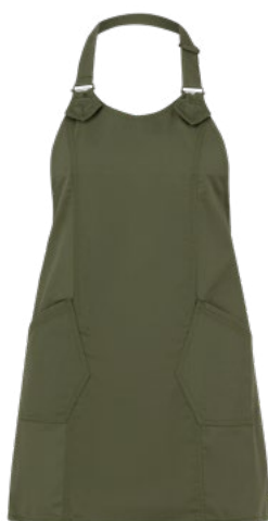
Z43 Verde militare