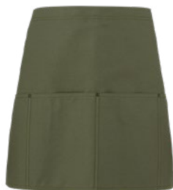
102 Verde militare