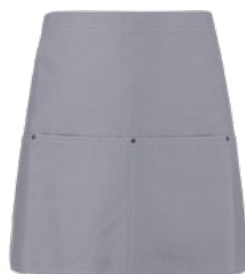
019 Grigio chiaro