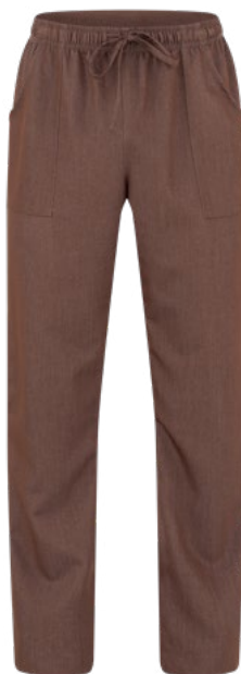
J322 Jeans marrone

Il pantalone Saul richiama il modello Alan con una linea più slim ed una vestibilità unisex. È realizzato in morbida poliviscosa con mano fluida che non aderisce al corpo. Un elastico alto 4 cm e una coulisse cingono la vita, mentre due tasche sui fianchi e una piccola tasca posteriore completano il capo. Il suo stile versatile lo rende adatto ad ambienti come SPA e studi medici, ma anche per un look urban in cucina, per ambienti moderni o per attività di street food. È proposto nelle varianti in jeans blu e jeans marrone.