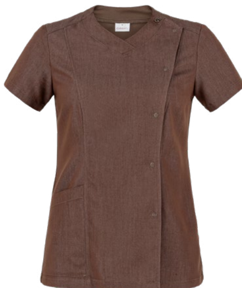
J322 Jeans marrone