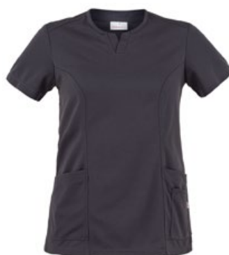
119 Grigio medio