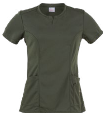
102 Verde militare