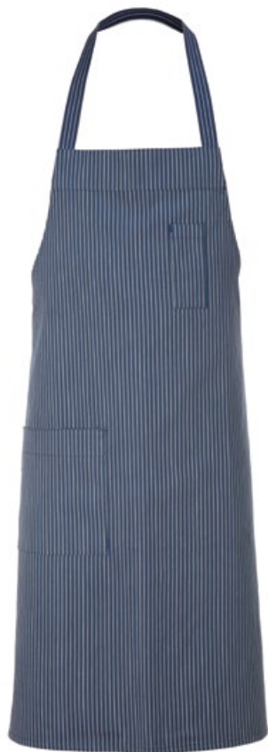
G004 Blue striped