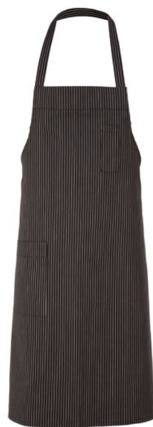
618 Gessato nero