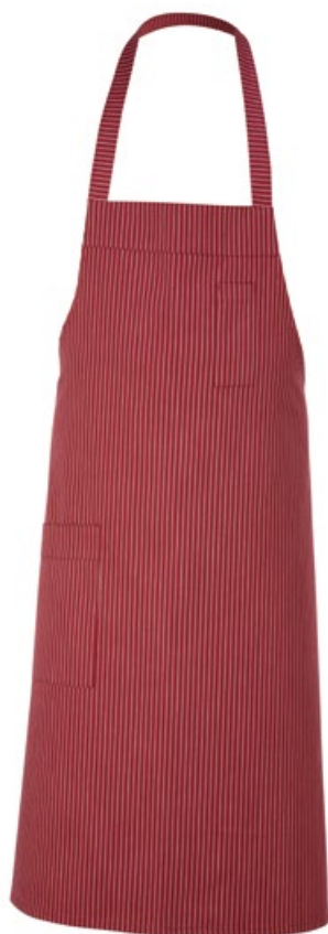
01 Burgundy striped