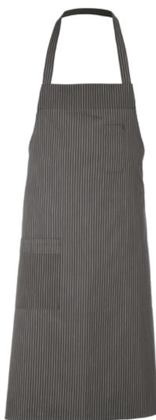
G119 Gessato grigio