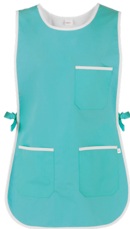
M19 Verde acqua