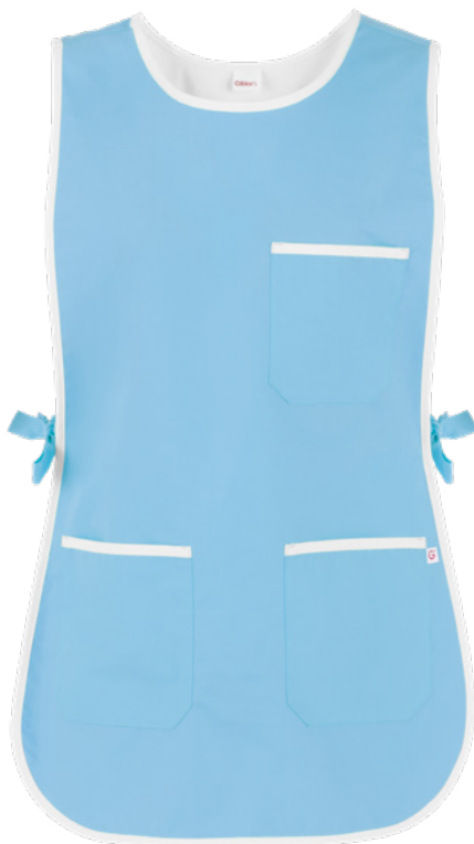
C08 Azzurro chiaro