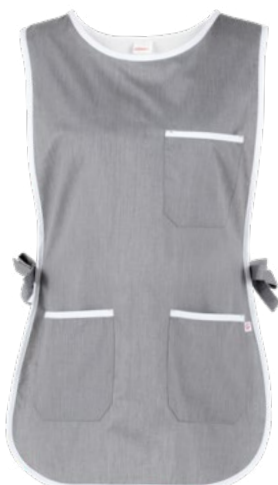
C02 Grigio chiaro