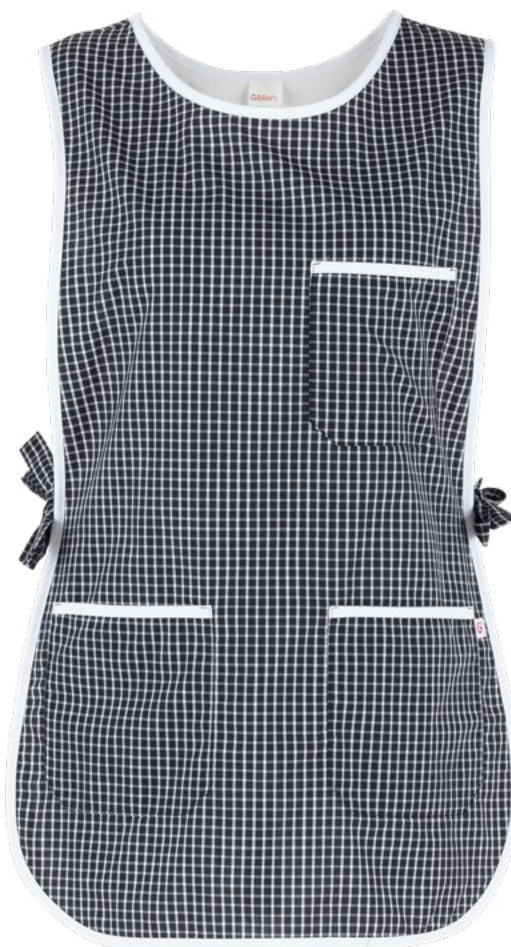
Q32 Quadro nero