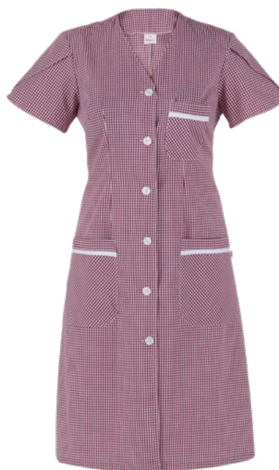
Q35 Bordeaux check