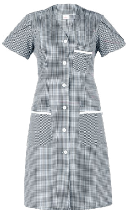
Q32 Quadro nero