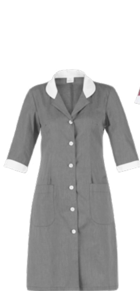
C02 Grigio chiaro