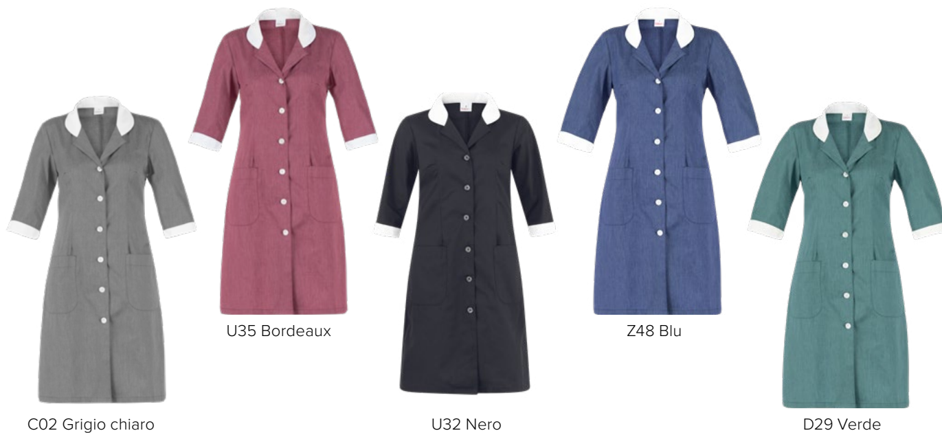
C02 Grigio chiaro