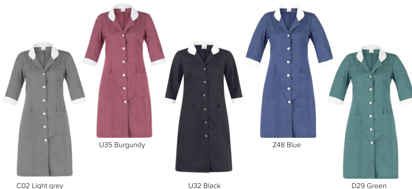
C02 Light grey