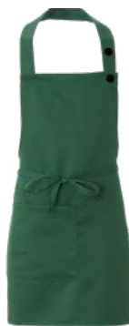
Z49 Verde scuro