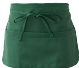
Z49 Verde scuro