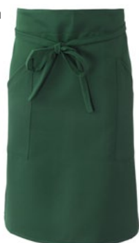
Z49 Verde scuro