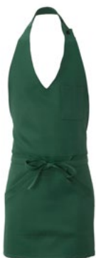
Z49 Verde scuro