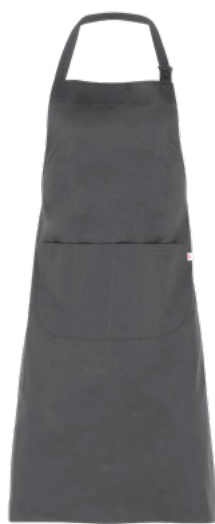
M12 Grigio medio