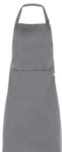
C02 Grigio chiaro