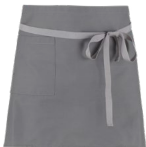
C02 Grigio chiaro