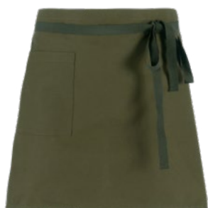
Z43 Military green