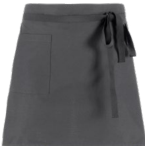
M12 Grigio medio