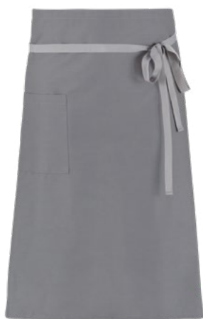
C02 Grigio chiaro