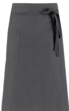
M12 Grigio medio