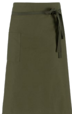
Z43 Verde militare