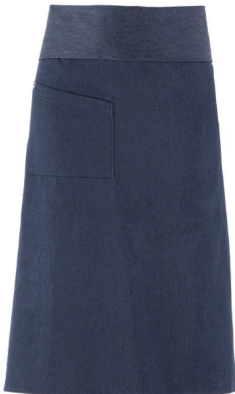
J004 Jeans blu