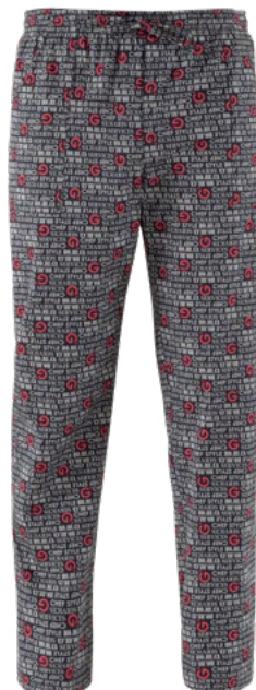
F020 G' horeca