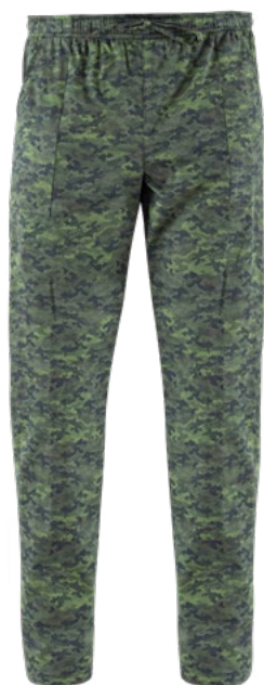
F019 Camouflage pixel