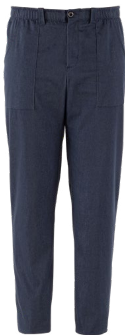
J004 Jeans blu