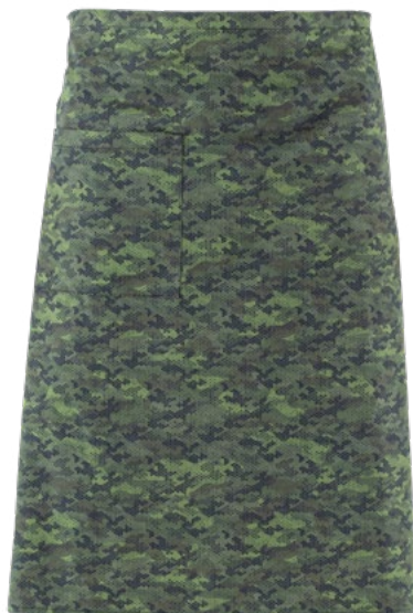
F019 Camouflage pixel