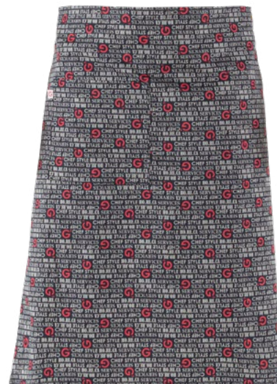
F020 G' horeca