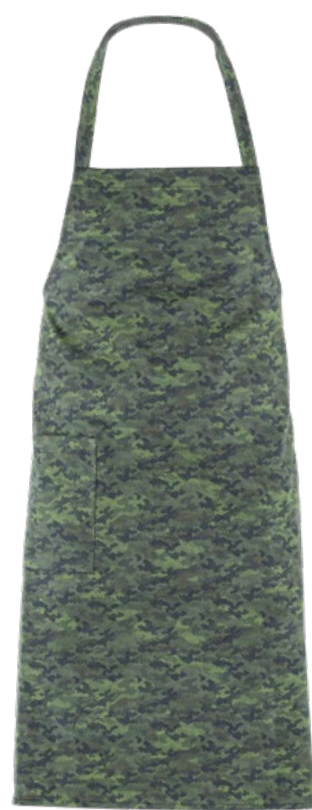
F019 Pixel camouflage