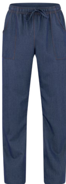
J004 Jeans blu