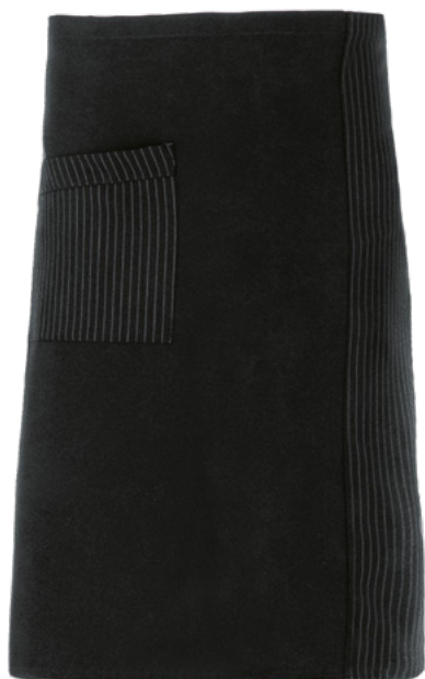
G000 Gessato nero

Il grembiule da lavoro unisex Rodano è una variante del grembiule Napoli. Si annoda in vita con i lacci ed è dotato di una comoda tasca sulla parte destra. Presenta un gioco di righe abbinato al tinta unita, in cui la tasca è a contrasto. Nella collezione 2020 è disponibile in tre nuove colorazioni: gessato nero, gessato grigio e gessato bordeaux. Caratterizzato da un ottimo rapporto qualità prezzo e valorizzato dalla tecnologia indantrene, è un capo perfetto per tutti i settori.