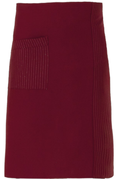
G006 Burgundy pinstripe