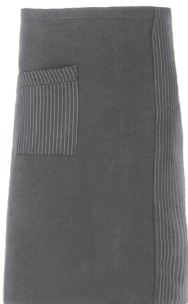
G119 Gessato grigio