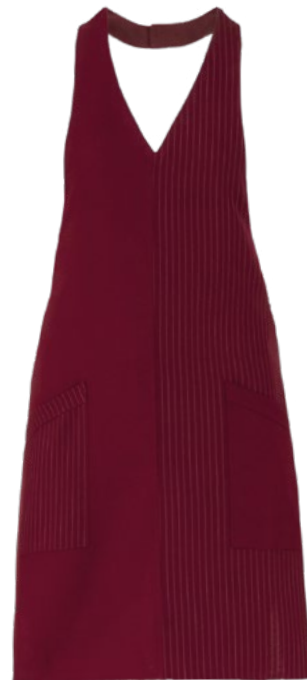
G006 Burgundy pinstripe