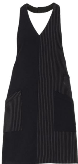
G000 Gessato nero