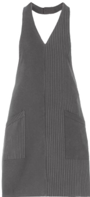
G119 Gessato grigio