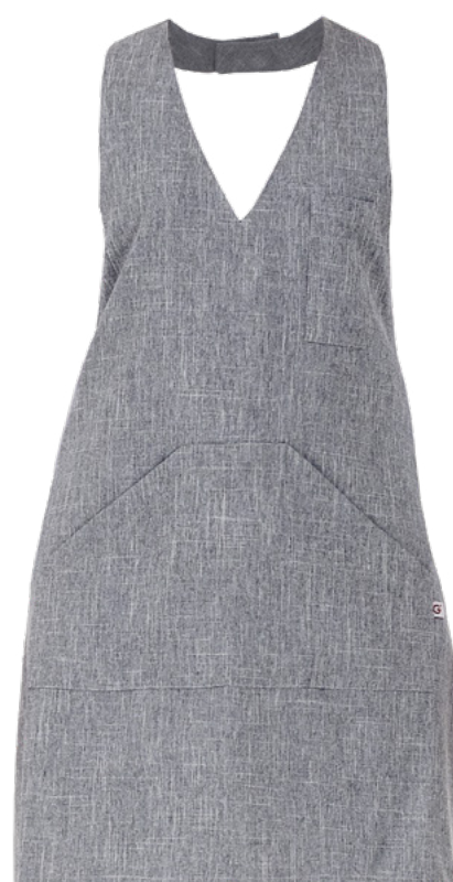
019 Grigio chiaro