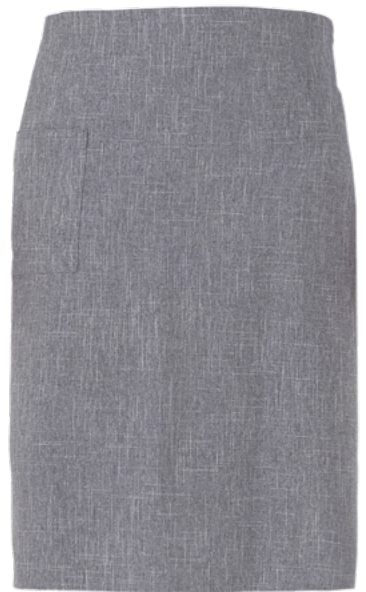
019 Light grey