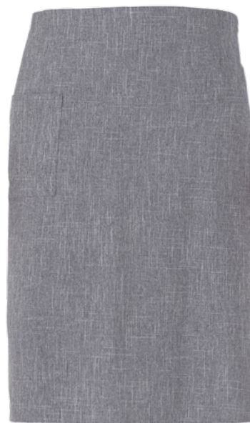
019 Grigio chiaro