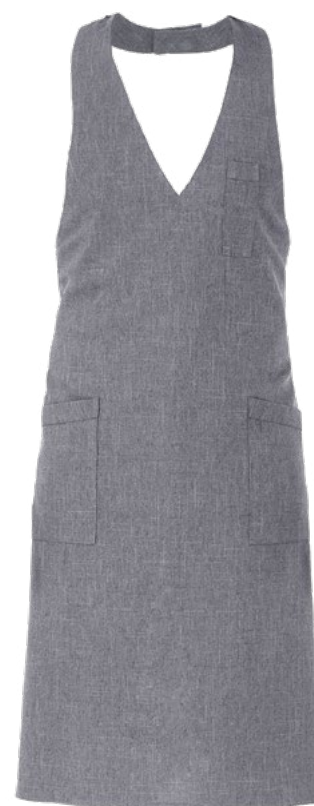
019 Grigio chiaro