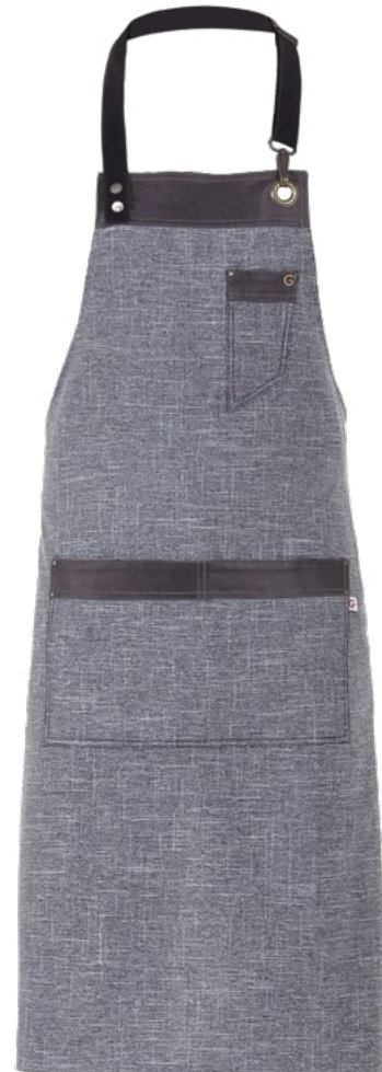
019 Grigio chiaro