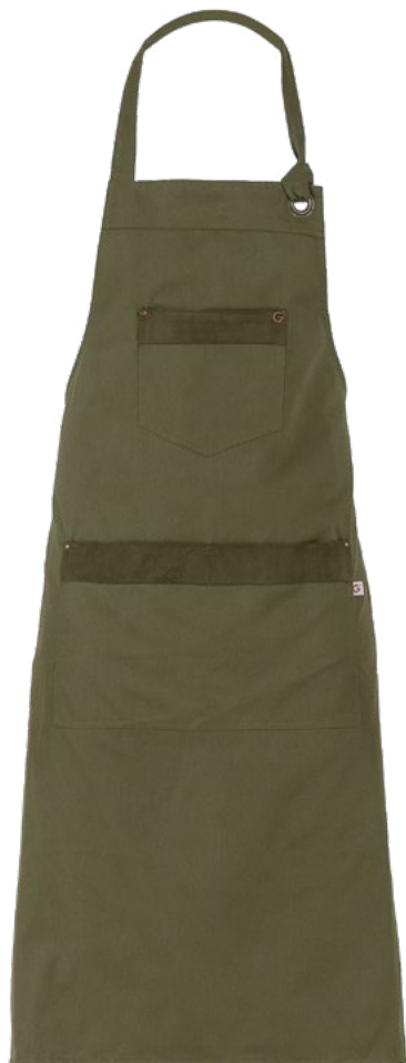
102 Verde militare