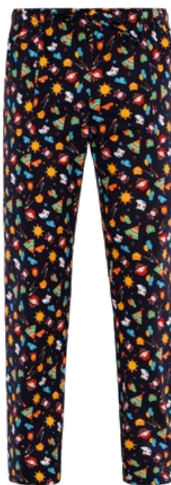
F013 Gufi indiani