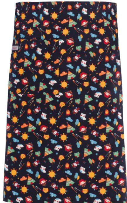
F013 Gufi indiani