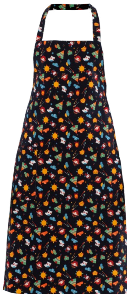
F013 Gufi indiani