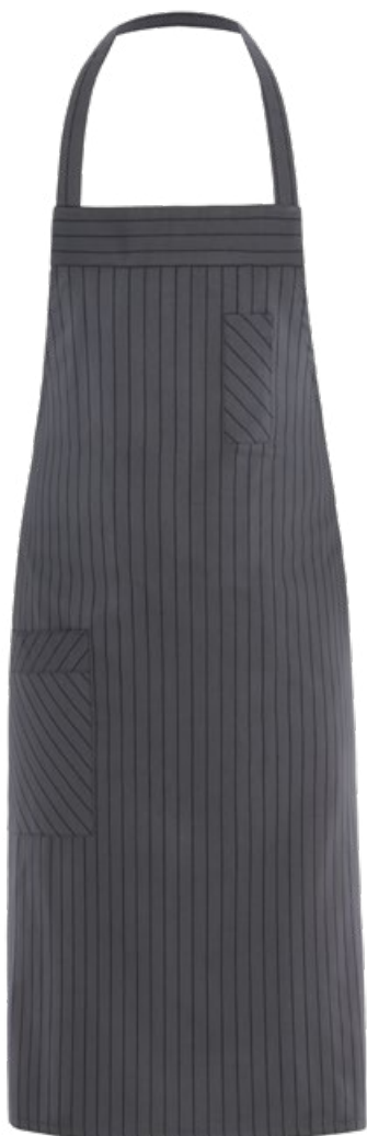
R119 Rigato grigio