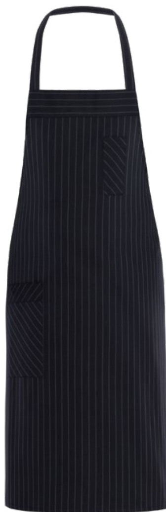
R000 Rigato nero