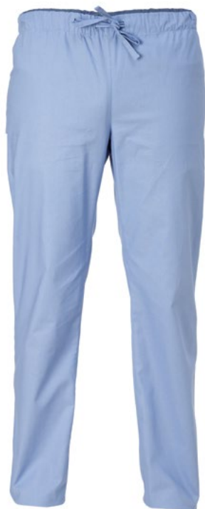
118 Light blue

Giblor's great classic: unisex high-waisted trousers with an excellent fit, loved for the Slim Fit of the leg.